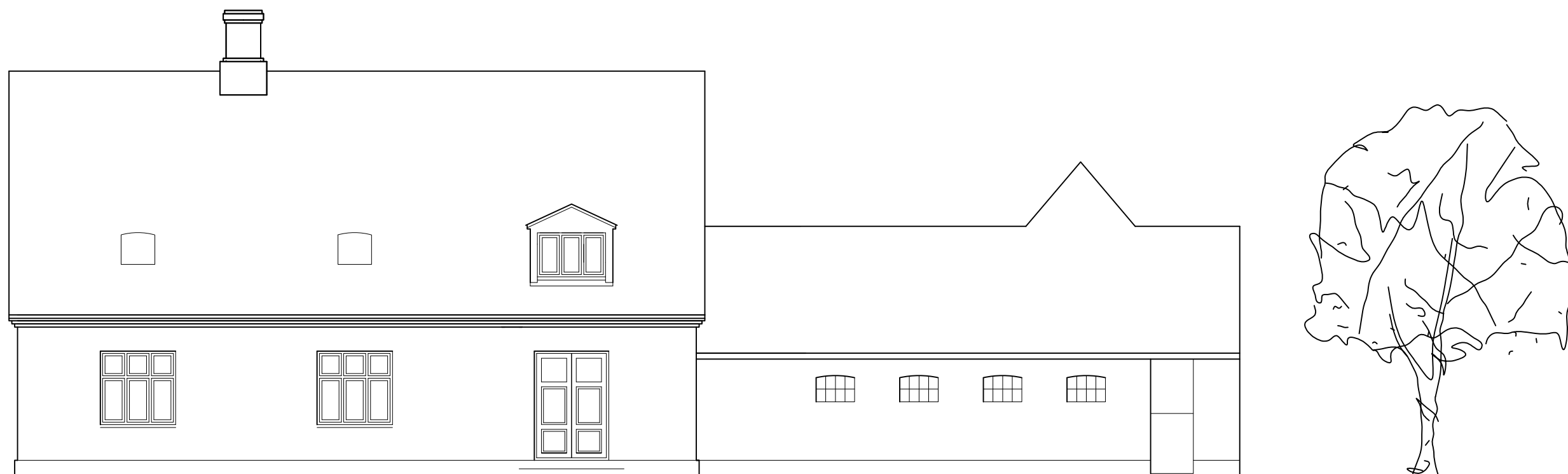
SYDØSTFACADE MOD VEJ

SKELGÅRDSSTRÆDE 9-11, 2770 KASTRUP FACADER MOD VEJ MÅL 1:100 TEGN. NR. 3-01 B DATO 28.04.2014 REV. B 09.05.2014