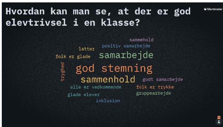
- Det fælles elevråd i Tårnby Kommune

For at det kan ske, kræver det et stabilt og højt fagligt kvalificeret personale, der bliver anerkendt i bestræbelserne på at skabe udvikling og sammenhæng for hvert enkelt barn og ung i fællesskabet. Ligeledes kræver det personale, der er relationskompetent og som mestrer alsidig faglig undervisning samt klasse- og gruppeledelse. Endelig fordrer det, at de mange forskellige børn og unges læring og udvikling bliver fulgt så nænsomt og tæt på den enkelte som muligt i bestræbelse på at undgå mistrivsel som følge af øgede krav, målstyring og tests. Derfor kan en meget differentieret tilgang til børnene og de unge med blik for, at der bliver taget hånd om den enkelte i fællesskabet, være med til at skabe tryghed og læring. Skolerne, SFO'erne og klubberne er derfor optagede af både at tage hånd om de børn og unge, der er i mistrivsel, men også af at øge den generelle trivsel for alle børn og unge ved at skabe positive, trygge og fagligt befordrende læringsrum, hvor alle kan lære og udvikle sig, trives og føle sig trygge.