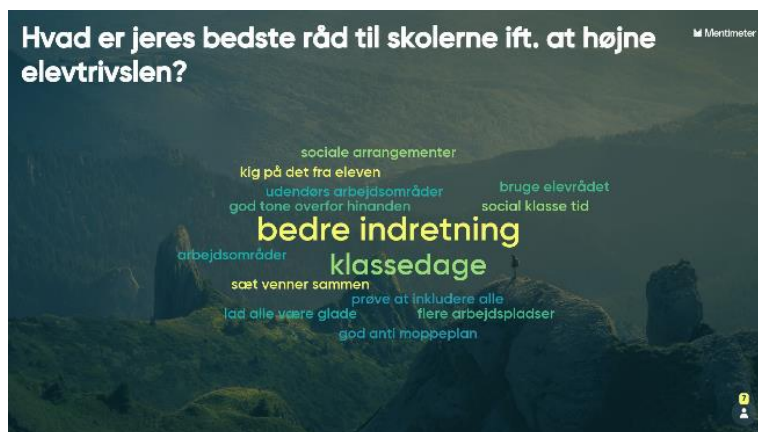
- Det fælles elevråd i Tårnby Kommune

På skolerne skal der vælges elevundervisningsmiljørepræsentanter. De kan med fordel vælges blandt elevrådsrepræsentanterne, og de skal inddrages i skolens undervisningsmiljøvurdering og det fortløbende arbejde med denne.